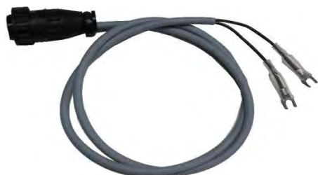
Кабель для форсунок BOSCH (универсальный)

Комплектация для стенда DORPAT Multi Cam.