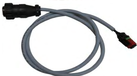
Кабель для форсунок DelphiE3 4-х контактных