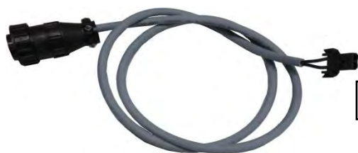
Кабель для форсунок VW