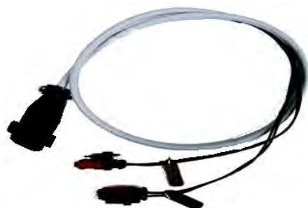
Кабель для форсунок DelphiE3 4-х контактных второго типа