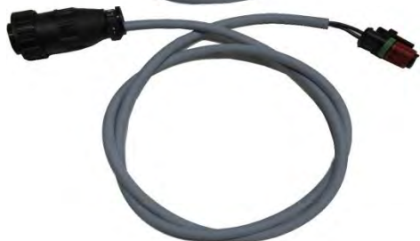
Кабель для форсунок Delphi 2-х контактных